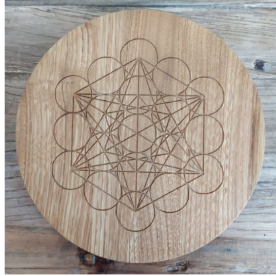
Matrice cristalline Châtaignier et cube de Métatron