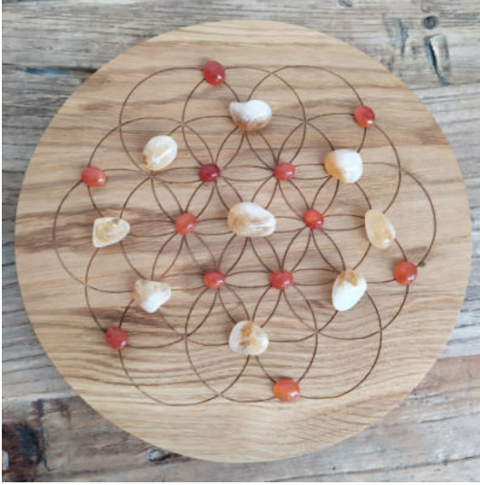
Matrice cristalline Chêne et graine de vie