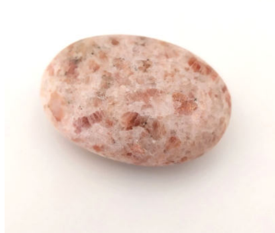
Galet de Pierre de Soleil