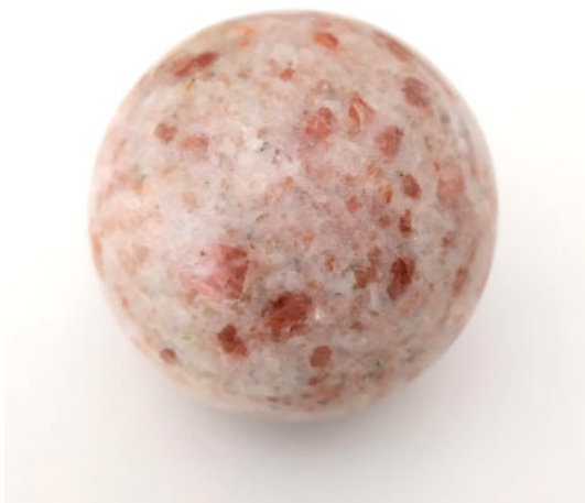
Sphère de Pierre de Soleil